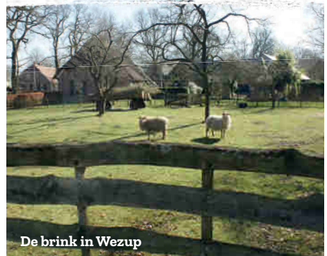
De brink in Wezup