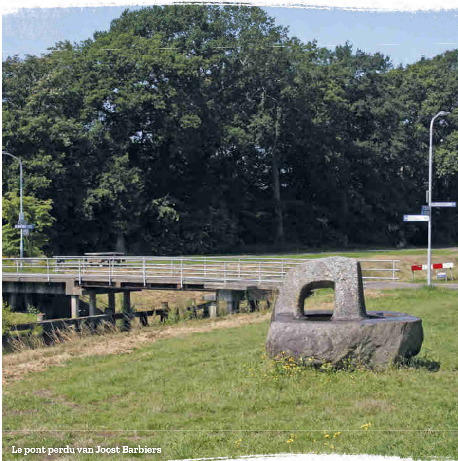
Le pont perdu van Joost Barbiers