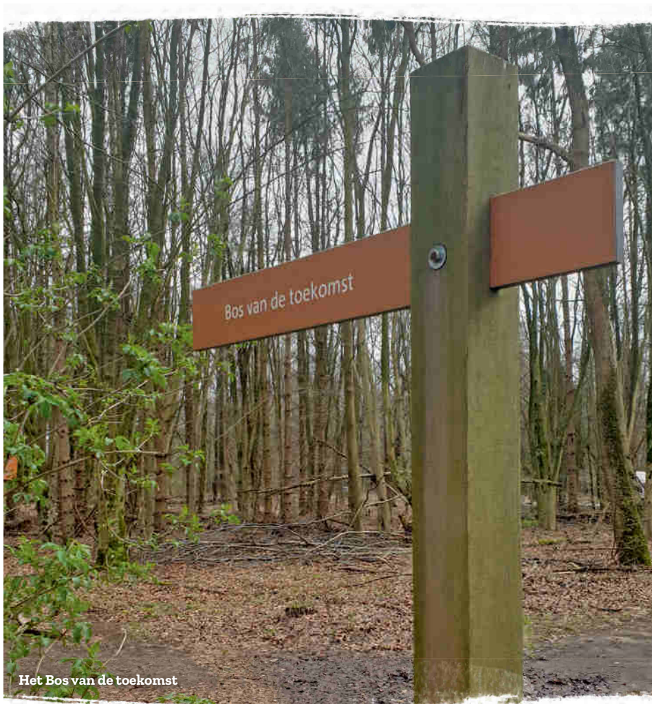
Het Bos van de toekomst