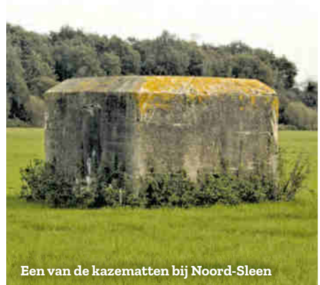
Een van de kazematten bij Noord-Sleen

aan drie zijden. Deze werden gebouwd tijdens de mobilisatie, in 1939, om een mogelijke aanval door Duitsland af te kunnen wenden. Van landbouwers werd ruimte voor het stallen van militaire paarden gevorderd. Sleen werd ingericht als basis voor de staf. Er werd een plan gemaakt voor evacuatie van de Sleaner bevolking naar Noord-Sleen en Erm.