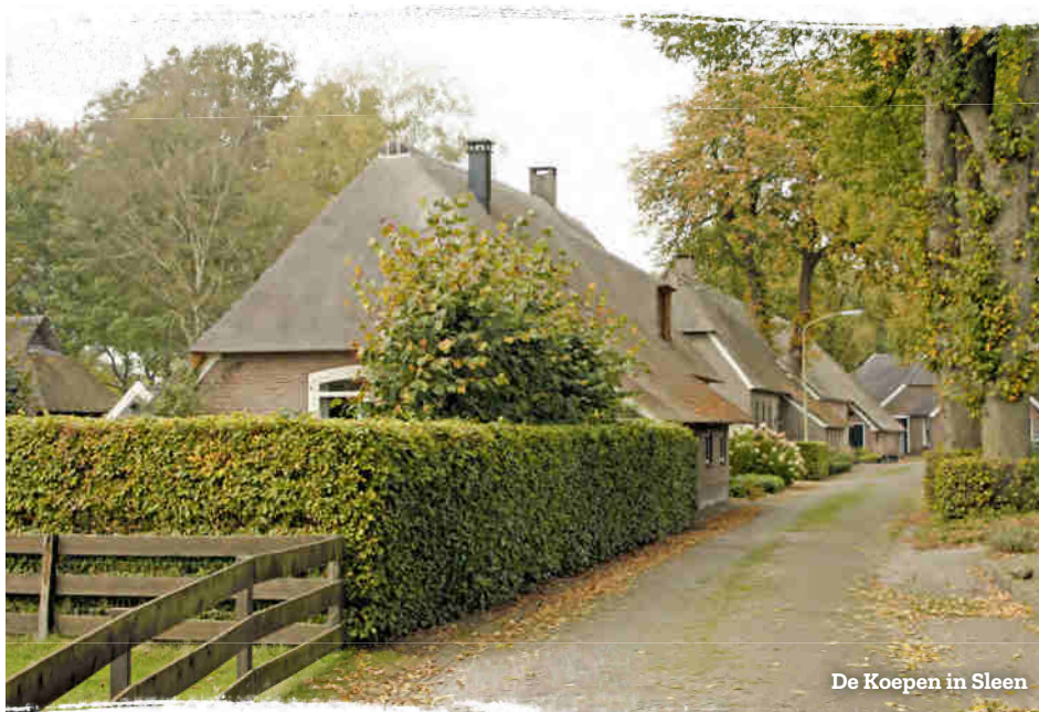
De Koepen in Sleen