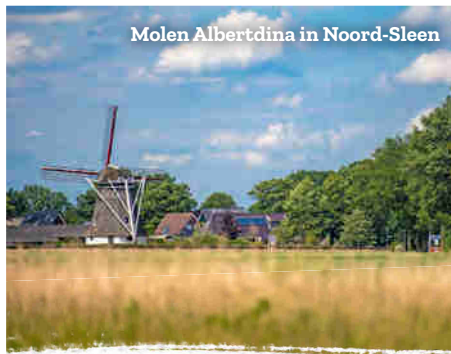
Molen Albertdina in Noord-Sleen