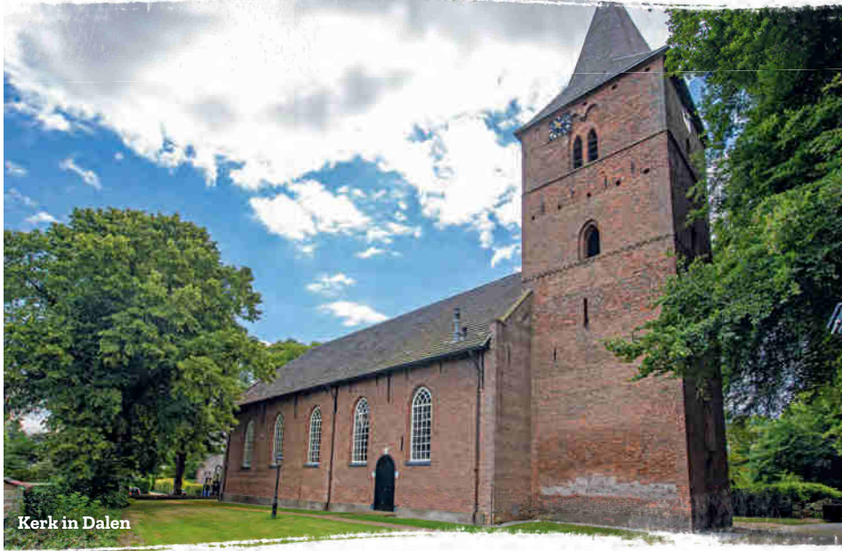
Kerk in Dalen