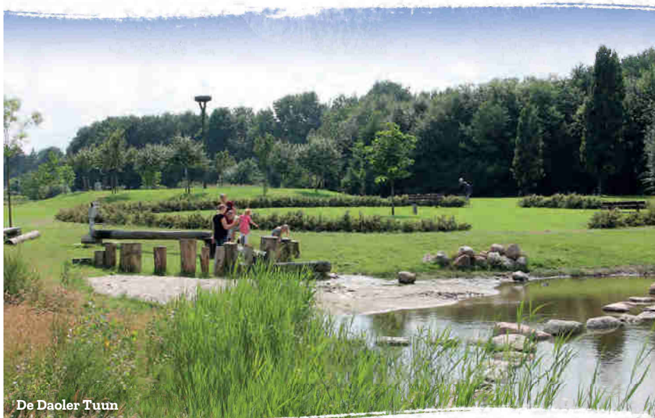
De Daoler Tuin